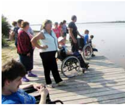
Funktionshindrade ungdomar och deras anhöriga på läger i Vitryssland.