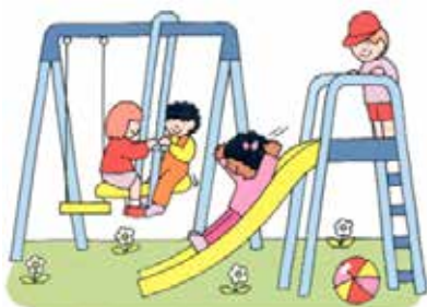
Lekplats i Kolkata