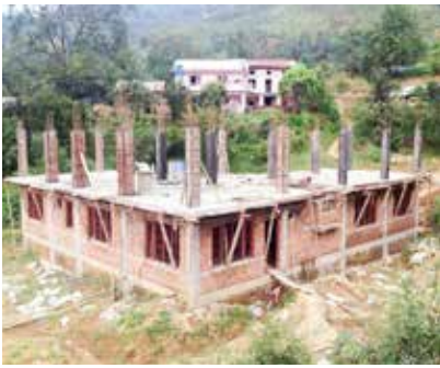
Nu bygger vi Bethel Restoration Center i Katmandu Nepal. Tack för din gåva!