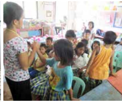
Barnen på Talima Elementary School har glatt sig åt lekar, sång och bibelberättelser.